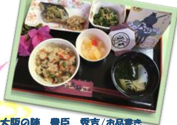
大阪の陣 豊臣 秀吉/お品書き 山菜御飯、鱈の生姜醤油焼き、若竹汁、 蓮根きんぴら、菜の花の酢味噌和え