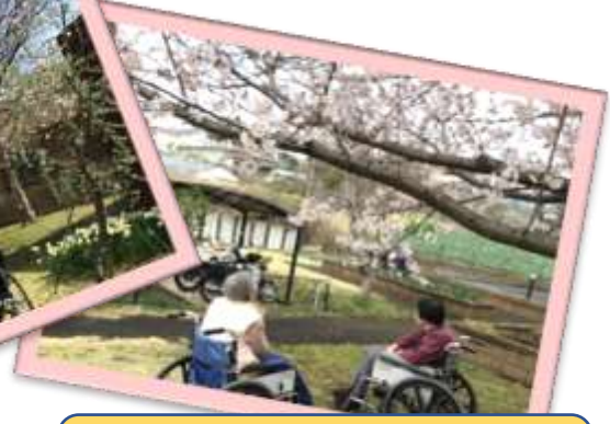
今年の桜も最高だね～