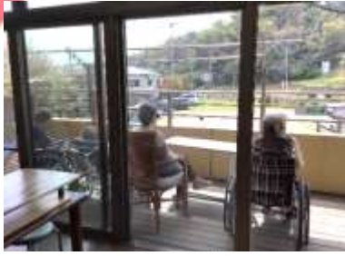
ユニットのベランダで ほかほか日向ほっこり