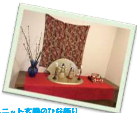
ユニット玄間のひな祭り