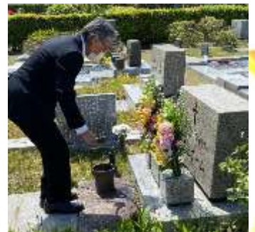
衣笠ホームでお暮しになられた方々を偲び、 礼拝を捧げました。