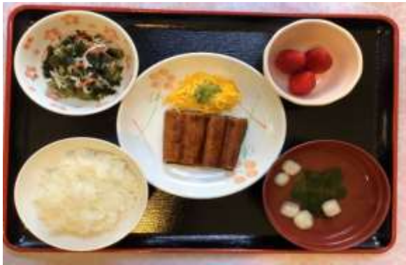
家族会の行事として、「うなぎ」を食べて いただきました。入居者の皆さまは、「美味しい～ 「元気出るよ～」と笑顔いっぱいでした