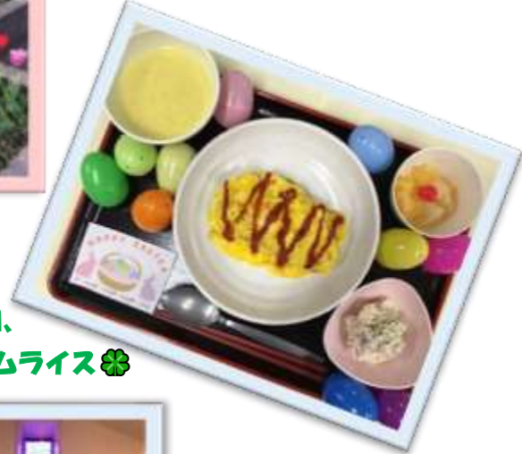
イースターの日、 昼食は、オムライス✿