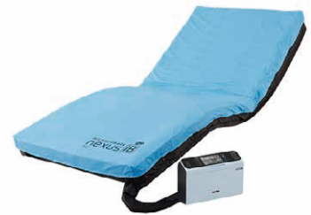
ネクサスIb エアーマット 引式ファンモーターが皮膚局所の温度・湿度の上昇を抑えるマットレス。

床ずれ防止用具は介護保険福祉用具貸与品目の一つで、様々な機能や性能を持った商品があるので、要介護者の方の状態や介護環境等を踏まえて、どの商品を選ぶかが大切です。また、見落としがちになりますが、ベッド上だけではなく、車いすの座位姿勢でも床ずれ発生のリスクはありますので、どの福祉用具を導入すべきか迷った際は、ケアマネジャーや担当の福祉用具専門相談員にご相談ください。