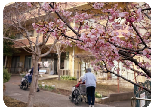
衣笠ホームの河津桜が咲きました。