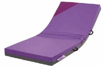
ウェブリーマットレス リバーシブル構造で快適な寝姿勢を保つことができる体圧分散マットレス。